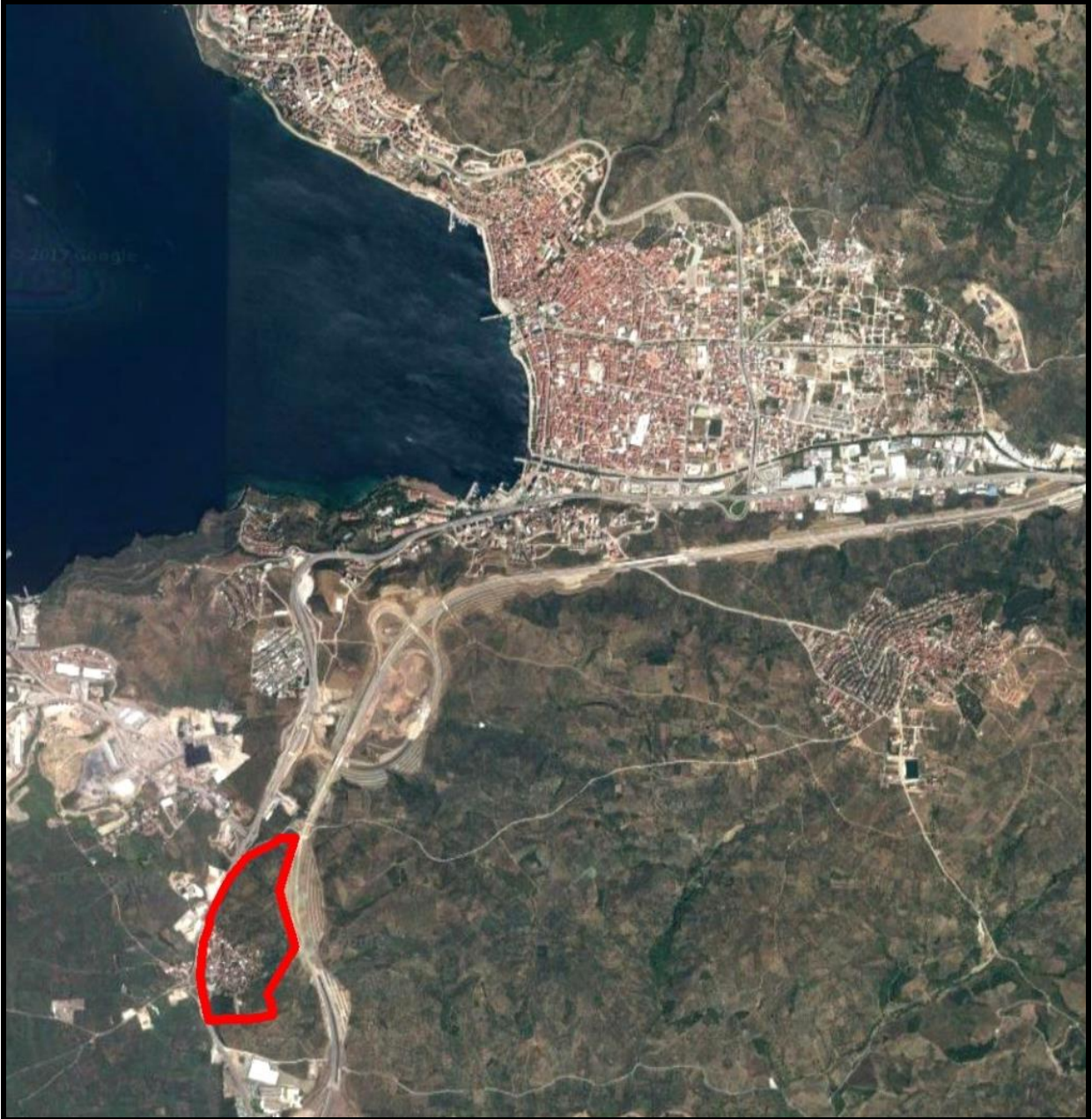
Şekil 1: Engürücük Mahallesinin Konumu

Plan değişikliğine konu Engürücük Mahallesi, Bursa İli, Gemlik İlçesinin mahallelerinden birisidir. Bursa İline 25 km, Gemlik ilçe merkezine 3 km uzaklıktadır. Bursa-Yalova (D575) Yolunun doğusunda konumlanmış olup, alanından batısından Bursa-İzmir Otoyolu geçmektedir.